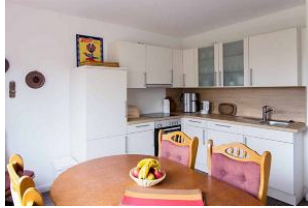
grosse Küche zum gemütlichen zusammensitzen