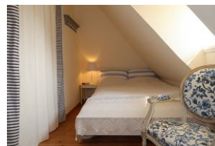
kleines Schlafzimmer im OG