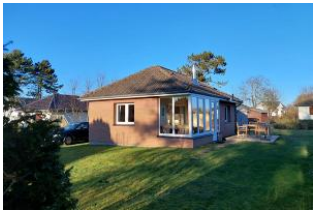
Aussenansicht des Hauses

Deelswai 50 ist ein Bungalow am Gotinger Kliff auf einem grossen Grundstück. Der Bungalow ist nur 2 min vom Gotinger Strand entfernt. Ein komfortables Einzelhaus mit Kamin, Wintergarten, grosser Garten und nur ein Katzensprung vom Meer entfernt. Hier haben Sie 1 Schlafzimmer mit Doppelbett, Badezimmer mit Dusche, separate Küche, Wohnbereich mit Kamin und Zugang zum Garten. Der schöne Garten wartet auf Sie, damit sie relaxen können. In diesem Nichtraucherhaus sind keine Haustiere erlaubt. Besondere Merkmale: Abstellmöglichk. f. Fahrräder, Allergikerfreundlich, Backofen, Bettwäsche/Handtücher*, CD-Player, Endreinigung*, Filterkaffeemaschine, Flachbild-TV, Föhn, Garten, Gartenmöbel, Gefrierfach, Grillmöglichkeit, Kamin, Kinderfreundlich, Nichtraucher, Parkplatz, Radio, Ruhig, Satelliten-TV, Seniorenfreundlich, Terrassenmöbel.