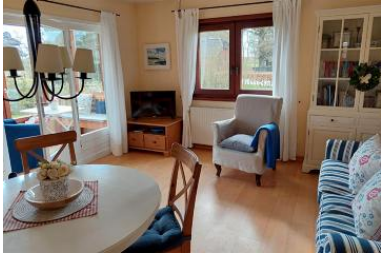
Die Unterkunft befindet sich im EG.

Deelswai 50 ist ein Bungalow am Gotinger Kliff auf einem grossen Grundstück. Der Bungalow ist nur 2 min vom Gotinger Strand entfernt. Ein komfortables Einzelhaus mit Kamin, Wintergarten, grosser Garten und nur ein Katzensprung vom Meer entfernt. Hier haben Sie 1 Schlafzimmer mit Doppelbett, Badezimmer mit Dusche, separate Küche, Wohnbereich mit Kamin und Zugang zum Garten. Der schöne Garten wartet auf Sie, damit sie relaxen können. In diesem Nichtraucherhaus sind keine Haustiere erlaubt. Besondere Merkmale: Abstellmöglichk. f. Fahrräder, Allergikerfreundlich, Backofen, Bettwäsche/Handtücher*, CD-Player, Endreinigung*, Filterkaffeemaschine, Flachbild-TV, Föhn, Garten, Gartenmöbel, Gefrierfach, Grillmöglichkeit, Kamin, Kinderfreundlich, Nichtraucher, Parkplatz, Radio, Ruhig, Satelliten-TV, Seniorenfreundlich, Terrassenmöbel.