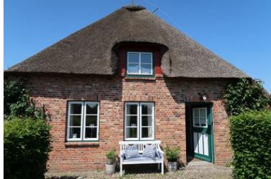
Eingangsbereich Amee Bonney