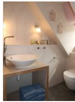
Badezimmer im OG mit Dusche und WC