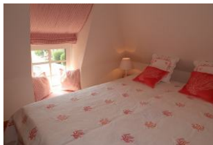
2 Schlafzimmer im OG