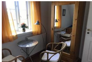
Ruheraum mit TV