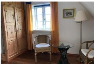
Schlafzimmer im Obergeschoss