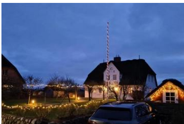
Die Unterkunft verteilt sich über EG, 1.OG und 2.OG.

Das Reetdachhausteil liegt in exponierter ruhig Lage, in einer Sackgasse, mit einem grossen Garten können Sie hier relaxen und entspannen und sie haben einen unverbauten Blick in einer aussergewöhnliche Lage mit Deichblick. Das gemütliche Haus besteht aus einem Wohnzimmer mit Kamin und direktem Zugang zum Garten mit Strandkorb, die Küche ist sehr gut ausgestattete mit Mikrowelle, Geschirrspüler und allem was man benötigt, im Erdgeschoss gehen sie auf warme Terracottafliesen Ein Badezimmer mit Dusche befindet sich im Erdgeschoss und das zweite Badezimmer mit Badewanne und Doppelwaschtisch im 1 OG. Im 1 OG haben Sie zwei Schlafzimmer mit einem 1,60 Bett und einem Kajüten Bett was man ausziehen kann für 2 Pers. Im 2. OG haben Sie einen kleinen Ruheraum mit Fernseher.