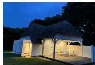
Saunahaus im Garten