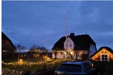
Die Unterkunft verteilt sich über EG, 1.OG und 2.OG.

Das Reetdachhausteil liegt in exponierter ruhig Lage, in einer Sackgasse, mit einem grossen Garten können Sie hier relaxen und entspannen und sie haben einen unverbauten Blick in einer aussergewöhnliche Lage mit Deichblick. Das gemütliche Haus besteht aus einem Wohnzimmer mit Kamin und direktem Zugang zum Garten mit Strandkorb, die Küche ist sehr gut ausgestattete mit Mikrowelle, Geschirrspüler und allem was man benötigt, im Erdgeschoss gehen sie auf warme Terracottafliesen Ein Badezimmer mit Dusche befindet sich im Erdgeschoss und das zweite Badezimmer mit Badewanne und Doppelwaschtisch im 1 OG. Im 1 OG haben Sie zwei Schlafzimmer mit einem 1,60 Bett und einem Kajüten Bett was man ausziehen kann für 2 Pers. Im 2. OG haben Sie einen kleinen Ruheraum mit Fernseher.