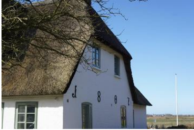
Die Unterkunft befindet sich im EG.

Die nordfriesische Insel Föhr ist bekannt für ihre idyllischen Friesendörfer und ihre malerische Marschlandschaft. Eines dieser charmanten Dörfer ist Midlum, wo sich unser Ferienhaus aus dem Jahr 1807 befindet. Das Haus grenzt direkt an Wiesen und Felder und besticht mit seinem typischen Reetdach und dem authentischen friesischen Charme. Von hier aus genießt du einen atemberaubenden Blick bis hin zum Deich, der kilometerweit entfernt liegt. Ein Aufenthalt in diesem Ferienhaus bietet somit nicht nur Erholung und Entspannung, sondern auch die Möglichkeit, die Schönheit der Föhrer Landschaft hautnah zu erleben. Das gesamte Haus bietet ausreichend Raum und Privatsphäre für zwei Familien, Freunde oder mehrere Generationen. Es gibt zwei Ferienwohnungen, die sich auf Erd- und Obergeschoss verteilen. Die Wohnungen sind komplett autark voneinander nutz- und buchbar. Gleichzeitig lassen sich die Wohnungen und Gärten wunderbar miteinander kombinieren. Das über 1000 m 2 große Grundstück ist dank seiner Gartenlandschaft mit Hecken und Zäunen zur Nachbarschaft gut abgegrenzt. Der Garten teilt sich jeweils für die Wohnungen auf. Sitzcken und Strandkörbe laden zu Ruhe und Entspannung an sonnigen Nachmittagen ein.