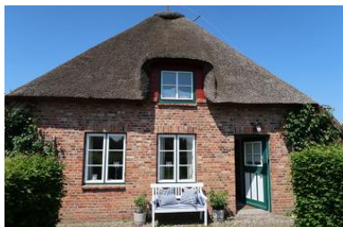
Eingangsbereich Amee Bonney