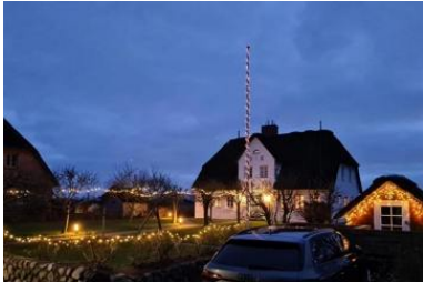
Die Unterkunft verteilt sich über EG, 1.OG und 2.OG.

Das Reetdachhausteil liegt in exponierter ruhig Lage, in einer Sackgasse, mit einem grossen Garten können Sie hier relaxen und entspannen und sie haben einen unverbauten Blick in einer aussergewöhnliche Lage mit Deichblick. Das gemütliche Haus besteht aus einem Wohnzimmer mit Kamin und direktem Zugang zum Garten mit Strandkorb, die Küche ist sehr gut ausgestattete mit Mikrowelle, Geschirrspüler und allem was man benötigt, im Erdgeschoss gehen sie auf warme Terracottafliesen Ein Badezimmer mit Dusche befindet sich im Erdgeschoss und das zweite Badezimmer mit Badewanne und Doppelwaschtisch im 1 OG. Im 1 OG haben Sie zwei Schlafzimmer mit einem 1,60 Bett und einem Kajüten Bett was man ausziehen kann für 2 Pers. Im 2. OG haben Sie einen kleinen Ruheraum mit Fernseher.