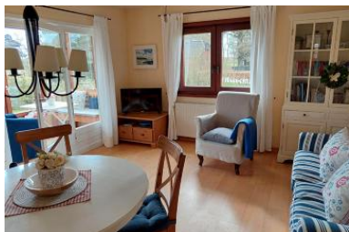
Die Unterkunft befindet sich im EG.

Deelswai 50 ist ein Bungalow am Gotinger Kliff auf einem grossen Grundstück. Der Bungalow ist nur 2 min vom Gotinger Strand entfernt. Ein komfortables Einzelhaus mit Kamin, Wintergarten, grosser Garten und nur ein Katzensprung vom Meer entfernt. Hier haben Sie 1 Schlafzimmer mit Doppelbett, Badezimmer mit Dusche, separate Küche, Wohnbereich mit Kamin und Zugang zum Garten. Der schöne Garten wartet auf Sie, damit sie relaxen können. In diesem Nichtraucherhaus sind keine Haustiere erlaubt. Besondere Merkmale: Abstellmöglichk. f. Fahrräder, Allergikerfreundlich, Backofen, Bettwäsche/Handtücher*, CD-Player, Endreinigung*, Filterkaffeemaschine, Flachbild-TV, Föhn, Garten, Gartenmöbel, Gefrierfach, Grillmöglichkeit, Kamin, Kinderfreundlich, Nichtraucher, Parkplatz, Radio, Ruhig, Satelliten-TV, Seniorenfreundlich, Terrassenmöbel.