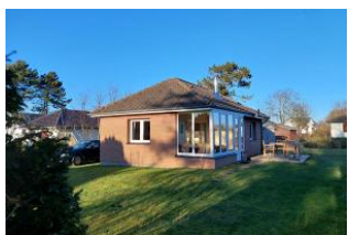
Aussenansicht des Hauses

Deelswai 50 ist ein Bungalow am Gotinger Kliff auf einem grossen Grundstück. Der Bungalow ist nur 2 min vom Gotinger Strand entfernt. Ein komfortables Einzelhaus mit Kamin, Wintergarten, grosser Garten und nur ein Katzensprung vom Meer entfernt. Hier haben Sie 1 Schlafzimmer mit Doppelbett, Badezimmer mit Dusche, separate Küche, Wohnbereich mit Kamin und Zugang zum Garten. Der schöne Garten wartet auf Sie, damit sie relaxen können. In diesem Nichtraucherhaus sind keine Haustiere erlaubt. Besondere Merkmale: Abstellmöglichk. f. Fahrräder, Allergikerfreundlich, Backofen, Bettwäsche/Handtücher*, CD-Player, Endreinigung*, Filterkaffeemaschine, Flachbild-TV, Föhn, Garten, Gartenmöbel, Gefrierfach, Grillmöglichkeit, Kamin, Kinderfreundlich, Nichtraucher, Parkplatz, Radio, Ruhig, Satelliten-TV, Seniorenfreundlich, Terrassenmöbel.