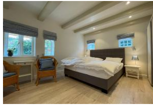
Schlafzimmer mit Boxspringbett