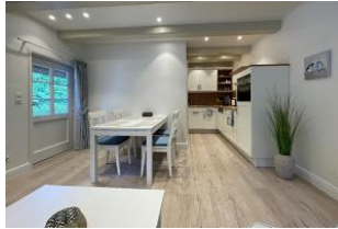
offene Küche mit Essbereich