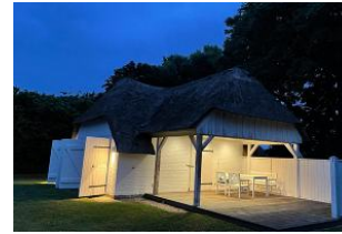
Saunahaus im Garten