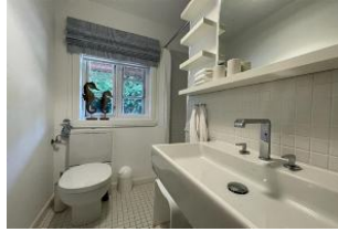
Badezimmer mit Dusche