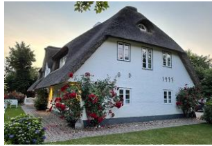
Haus vom Garten aus