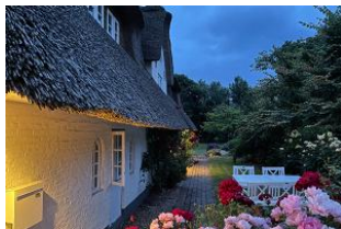
Abendstimmung in Borgsum