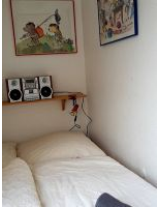
Blick ns 2. Schlafzimmer mit einem 1,40 m Bett