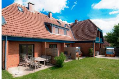
Ansicht von Wohnung 1-3

Die Unterkunft verteilt sich über EG und 1.OG.