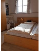
Schlafzimmer im OG