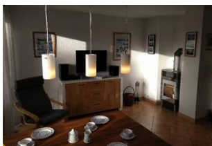
Wohnzimmer mit Kamin