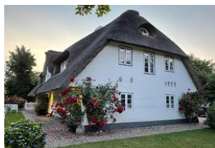
Haus vom Garten aus