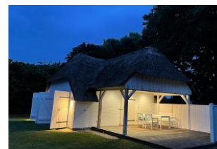
Saunahaus im Garten