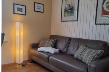
Die Unterkunft befindet sich im EG.

Die ebenerdige Wohnung Seepferdchen in Nico?s Hüs liegt ruhig und in zweiter Reihe am Wyker Stadtrand.