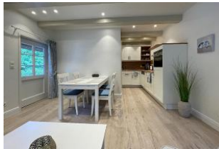
offene Küche mit Essbereich