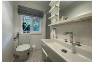
Badezimmer mit Dusche