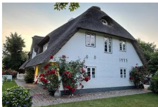
Haus vom Garten aus