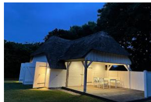
Saunahaus im Garten