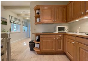
Küche mit Essbereich