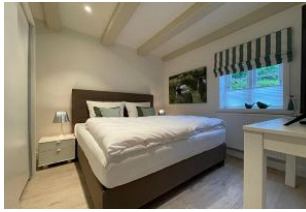
Schlafzimmer mit Boxspringbett