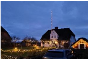
Die Aussenansicht in der Winterzeit

Das Reetdachhausteil liegt in exponierter ruhig Lage, in einer Sackgasse, mit einem grossen Garten können Sie hier relaxen und entspannen und sie haben einen unverbauten Blick in einer aussergewöhnliche Lage mit Deichblick. Das gemütliche Haus besteht aus einem Wohnzimmer mit Kamin und direktem Zugang zum Garten mit Strandkorb, die Küche ist sehr gut ausgestattete mit Mikrowelle, Geschirrspüler und allem was man benötigt, im Erdgeschoss gehen sie auf warme Terracottafliesen Ein Badezimmer mit Dusche befindet sich im Erdgeschoss und das zweite Badezimmer mit Badewanne und Doppelwaschtisch im 1 OG. Im 1 OG haben Sie zwei Schlafzimmer mit einem 1,60 Bett und einem Kajüten Bett was man ausziehen kann für 2 Pers. Im 2. OG haben Sie einen kleinen Ruheraum mit Fernseher.