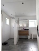
Großes Bad mit Dusche und WC