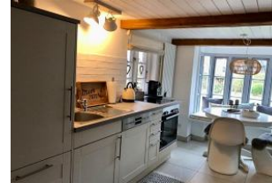
separate Küche mit Esstisch