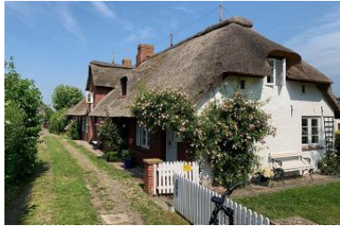
Die Unterkunft verteilt sich über EG und 1.OG.

Idyllische Ferien auf Föhr im historischen Ortskern des Kurortes Alkersum FÖHRliebt - gemütliches Ferienhaus unter Reet Unsere "2" Heimat" befindet sich in einem historischen Gebäudekomplex als "ENDhaus". Umgeben von einem romantisch großen Garten in südwestlich ausgerichteter Richtung und unendlicher Natur. Eingebettet in Geest und Marsch, den inseltypischen Landschaftsformen, die unsere Besucher zu Fuß oder per Fahrrad zur Erkundung von Flora und Fauna einladen. Das 50qm große Ferienhaus "FÖHRliebt" ist ideal für zwei Personen und befindet sich in sehr ruhiger Lage. Für den Auto-Durchfahrtsverkehr gesperrten "Stieg", im Ortskern des Kunst- und Pferdedorfes Alkersum - im Herzen der schoenen Insel Föhr. Der friesischen Karibik. Ein Bäcker, sowie der Hofladen "Föhler Inselkäse", befinden sich in unmittelbarer Nähe und sind fußläufig zu erreichen (ca. 200m). Mit dem Fahrrad zum nächstgelegenen Strand nach Goting, sind es ca. 10 Minuten, nach Utersum rund 15 und nach Wyk Stadt ebenfalls ca. nur 10 Minuten.