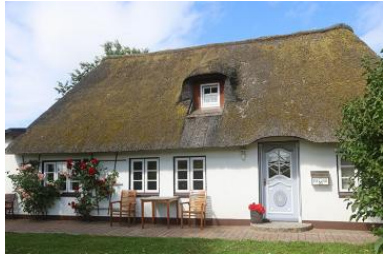
Schönes gemütliches Friesenhausteil.