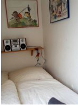
Blick ns 2. Schlafzimmer mit einem 1,40 m Bett