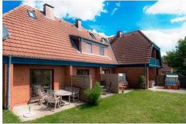
Ansicht von Wohnung 1-3

Die Unterkunft verteilt sich über EG und 1.OG.