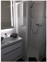
Badezimmer mit Dusche