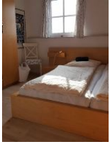
Schlafzimmer im OG