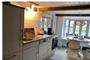
separate Küche mit Esstisch