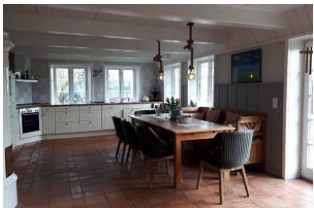
grosse helle Küche

Unser Haus befindet sich in Oldsum, ein ruhiges, z.T. landwirtschaftlich geprägtes Künstlerdorf mit vielen traditionellen Friesenhäusern. Traditionelle Friesenbauart, Reetdach, Holzdecke, Holzsprossenfenster, Kachelofen. Cottofliesen im Erdgeschoss, heller Eichenboden im ersten Stock. Große lichtdurchflutete Galerie im Eingangsbereich. 800 qm Grundstück mit einem freien Blick auf eine Pferdekoppel. Im Ort befinden sich zwei Cafés, ein Gasthaus, zwei Bauernläden, ein Sparmarkt mit frischen Brötchen, Fahrradverleih, Bastelladen. Das Haus ist 160 qm groß und bietet komfortablen Raum für 7 Personen (4 Erwachsene und 3 Kinder). Neben dem großzügigen, offenen Wohnzimmer und einer mit modernster Technik ausgestatteten, großen Wohnküche, gibt es vier Schlafzimmer, zwei mit Doppelbetten, eines mit zwei Einzelbetten, zusätzlich ein Einzelzimmer. Ein Bad mit Dusche, WC und Badewanne, eines mit Dusche und WC, zusätzlich ein WC.