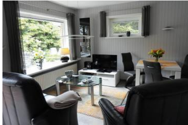
Die Unterkunft befindet sich im EG.

In unserem Urlaubsdomizil am Goting-Kliff bieten wir in unseren komfortablen Bungalow mit eingezäuntem Garten. Das Haus befindet sich auf einem 4000 m 2 großem Grundstück. Das Objekt liegt in ruhiger, strandnaher Lage. Der Badestrand ist in wenigen Minuten zu Fuß erreichbar. Das großzügig eingerichtete Wohnzimmer lädt zum Verweilen ein. Ein komplett ausgestattete Küche mit Backofen, Mikrowelle und Geschirrspüler ist vorhanden. Im Schlafzimmer befindet sich ein seniorengerechtes Doppelbett. WC und Dusche sind vorhanden. Eine separate Terrasse mit Gartenmöbel und Strandkorb steht den Gästen zur Verfügung. Parkplätze am Haus sind vorhanden.