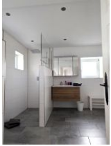
Großes Bad mit Dusche und WC