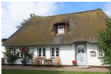
Schönes gemütliches Friesenhausteil.