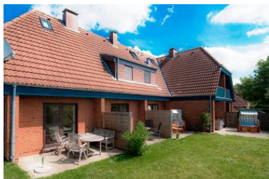
Ansicht von Wohnung 1-3

Die Unterkunft verteilt sich über EG und 1.OG.