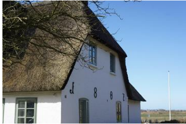
Die Unterkunft befindet sich im 1.OG.

Die nordfriesische Insel Föhr ist bekannt für ihre idyllischen Friesendörfer und ihre malerische Marschlandschaft. Eines dieser charmanten Dörfer ist Midlum, wo sich unser Ferienhaus aus dem Jahr 1807 befindet. Das Haus grenzt direkt an Wiesen und Felder und besticht mit seinem typischen Reetdach und dem authentischen friesischen Charme. Von hier aus genießt du einen atemberaubenden Blick bis hin zum Deich, der kilometerweit entfernt liegt. Ein Aufenthalt in diesem Ferienhaus bietet somit nicht nur Erholung und Entspannung, sondern auch die Möglichkeit, die Schönheit der Föhrer Landschaft hautnah zu erleben. Das gesamte Haus bietet ausreichend Raum und Privatsphäre für zwei Familien, Freunde oder mehrere Generationen. Es gibt zwei Ferienwohnungen, die sich auf Erd- und Obergeschoss verteilen. Die Wohnungen sind komplett autark voneinander nutz- und buchbar. Gleichzeitig lassen sich die Wohnungen und Gärten wunderbar miteinander kombinieren. Das über 1000 m 2 große Grundstück ist dank seiner Gartenlandschaft mit Hecken und Zäunen zur Nachbarschaft gut abgegrenzt. Der Garten teilt sich jeweils für die Wohnungen auf. Sitzcken und Strandkörbe laden zu Ruhe und Entspannung an sonnigen Nachmittagen ein.