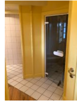
Dampfsauna im Badezimmer