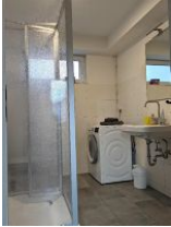
Kleines Bad mit Waschmaschine,Dusche und WC