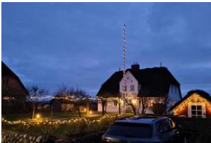
Die Aussenansicht in der Winterzeit

Das Reetdachhausteil liegt in exponierter ruhig Lage, in einer Sackgasse, mit einem grossen Garten können Sie hier relaxen und entspannen und sie haben einen unverbauten Blick in einer aussergewöhnliche Lage mit Deichblick. Das gemütliche Haus besteht aus einem Wohnzimmer mit Kamin und direktem Zugang zum Garten mit Strandkorb, die Küche ist sehr gut ausgestattete mit Mikrowelle, Geschirrspüler und allem was man benötigt, im Erdgeschoss gehen sie auf warme Terracottafliesen Ein Badezimmer mit Dusche befindet sich im Erdgeschoss und das zweite Badezimmer mit Badewanne und Doppelwaschtisch im 1 OG. Im 1 OG haben Sie zwei Schlafzimmer mit einem 1,60 Bett und einem Kajüten Bett was man ausziehen kann für 2 Pers. Im 2. OG haben Sie einen kleinen Ruheraum mit Fernseher.