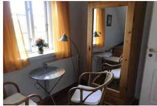
Ruheraum mit TV