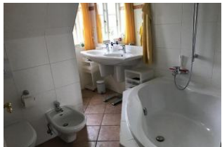
zweites Badezimmer im Obergeschoss mit Badewanne und Doppelwaschbecken