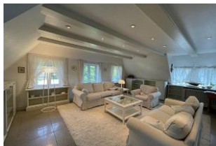
grosses helles Wohnzimmer