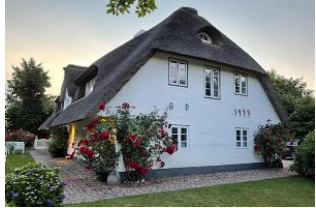
Haus vom Garten aus