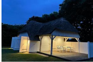
Saunahaus im Garten