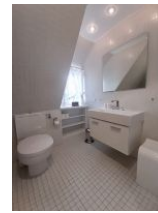
Badezimmer mit Dusche