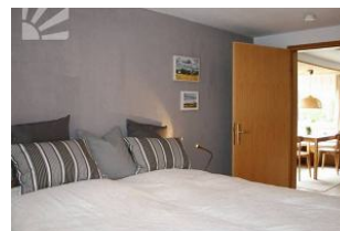
Schlafzimmer mit Einbauschränk