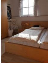
Schlafzimmer im OG