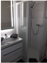
Badezimmer mit Dusche