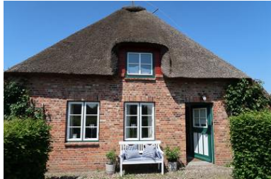
Eingangsbereich Amee Bonney