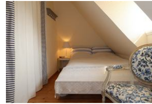
kleines Schlafzimmer im OG