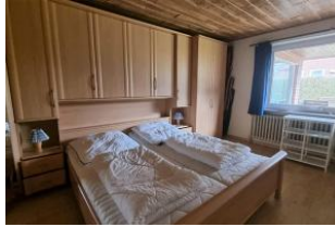
Schlafzimmer mit zweitem TV