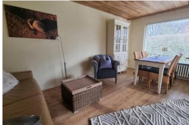
Wohnbereich mit Schlafcouch