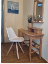
Badezimmer mit Dusche