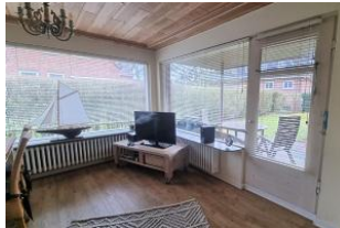
Wohnbereich mit Zugang zur überdachten Terrasse