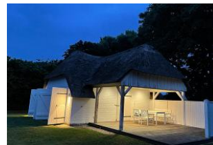
Saunahaus im Garten