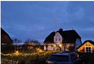
Die Aussenansicht in der Winterzeit

Das Reetdachhausteil liegt in exponierter ruhig Lage, in einer Sackgasse, mit einem grossen Garten können Sie hier relaxen und entspannen und sie haben einen unverbauten Blick in einer aussergewöhnliche Lage mit Deichblick. Das gemütliche Haus besteht aus einem Wohnzimmer mit Kamin und direktem Zugang zum Garten mit Strandkorb, die Küche ist sehr gut ausgestattete mit Mikrowelle, Geschirrspüler und allem was man benötigt, im Erdgeschoss gehen sie auf warme Terracottafliesen Ein Badezimmer mit Dusche befindet sich im Erdgeschoss und das zweite Badezimmer mit Badewanne und Doppelwaschtisch im 1 OG. Im 1 OG haben Sie zwei Schlafzimmer mit einem 1,60 Bett und einem Kajüten Bett was man ausziehen kann für 2 Pers. Im 2. OG haben Sie einen kleinen Ruheraum mit Fernseher.