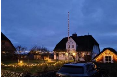
Die Unterkunft verteilt sich über EG, 1.OG und 2.OG.

Das Reetdachhausteil liegt in exponierter ruhig Lage, in einer Sackgasse, mit einem grossen Garten können Sie hier relaxen und entspannen und sie haben einen unverbauten Blick in einer aussergewöhnliche Lage mit Deichblick. Das gemütliche Haus besteht aus einem Wohnzimmer mit Kamin und direktem Zugang zum Garten mit Strandkorb, die Küche ist sehr gut ausgestattete mit Mikrowelle, Geschirrspüler und allem was man benötigt, im Erdgeschoss gehen sie auf warme Terracottafliesen Ein Badezimmer mit Dusche befindet sich im Erdgeschoss und das zweite Badezimmer mit Badewanne und Doppelwaschtisch im 1 OG. Im 1 OG haben Sie zwei Schlafzimmer mit einem 1,60 Bett und einem Kajüten Bett was man ausziehen kann für 2 Pers. Im 2. OG haben Sie einen kleinen Ruheraum mit Fernseher.