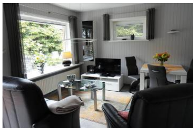
Die Unterkunft befindet sich im EG.

In unserem Urlaubsdomizil am Goting-Kliff bieten wir in unseren komfortablen Bungalow mit eingezäuntem Garten. Das Haus befindet sich auf einem 4000 m 2 großem Grundstück. Das Objekt liegt in ruhiger, strandnaher Lage. Der Badestrand ist in wenigen Minuten zu Fuß erreichbar. Das großzügig eingerichtete Wohnzimmer lädt zum Verweilen ein. Ein komplett ausgestattete Küche mit Backofen, Mikrowelle und Geschirrspüler ist vorhanden. Im Schlafzimmer befindet sich ein seniorengerechtes Doppelbett. WC und Dusche sind vorhanden. Eine separate Terrasse mit Gartenmöbel und Strandkorb steht den Gästen zur Verfügung. Parkplätze am Haus sind vorhanden.