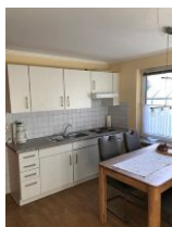
Küche und Wohnbereich