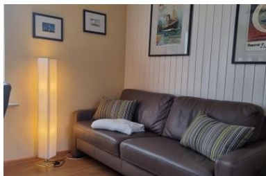
Die Unterkunft befindet sich im EG.

Die ebenerdige Wohnung Seepferdchen in Nico?s Hüs liegt ruhig und in zweiter Reihe am Wyker Stadtrand.