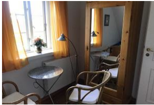
Ruheraum mit TV