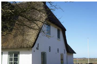
Die Unterkunft befindet sich im 1.OG.

Die nordfriesische Insel Föhr ist bekannt für ihre idyllischen Friesendörfer und ihre malerische Marschlandschaft. Eines dieser charmanten Dörfer ist Midlum, wo sich unser Ferienhaus aus dem Jahr 1807 befindet. Das Haus grenzt direkt an Wiesen und Felder und besticht mit seinem typischen Reetdach und dem authentischen friesischen Charme. Von hier aus genießt du einen atemberaubenden Blick bis hin zum Deich, der kilometerweit entfernt liegt. Ein Aufenthalt in diesem Ferienhaus bietet somit nicht nur Erholung und Entspannung, sondern auch die Möglichkeit, die Schönheit der Föhrer Landschaft hautnah zu erleben. Das gesamte Haus bietet ausreichend Raum und Privatsphäre für zwei Familien, Freunde oder mehrere Generationen. Es gibt zwei Ferienwohnungen, die sich auf Erd- und Obergeschoss verteilen. Die Wohnungen sind komplett autark voneinander nutz- und buchbar. Gleichzeitig lassen sich die Wohnungen und Gärten wunderbar miteinander kombinieren. Das über 1000 m 2 große Grundstück ist dank seiner Gartenlandschaft mit Hecken und Zäunen zur Nachbarschaft gut abgegrenzt. Der Garten teilt sich jeweils für die Wohnungen auf. Sitzcken und Strandkörbe laden zu Ruhe und Entspannung an sonnigen Nachmittagen ein.