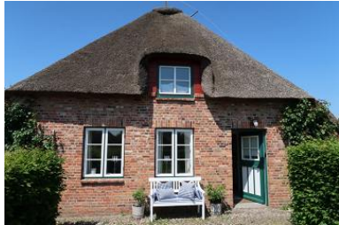
Eingangsbereich Amee Bonney