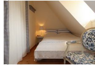
kleines Schlafzimmer im OG