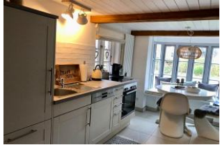
separate Küche mit Esstisch