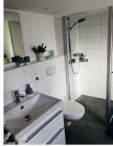
Badezimmer mit Dusche