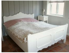
Schlafzimmer im EG